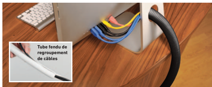
Tube fendu de regroupement de câbles