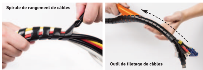
Spirale de rangement de câbles