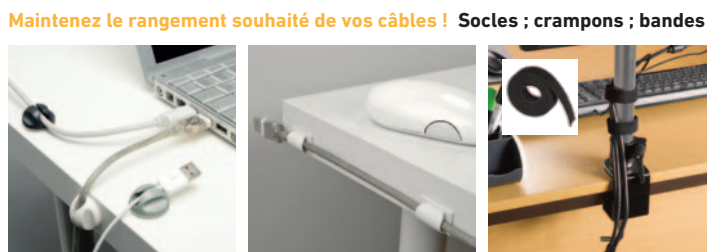
Maintenez le rangement souhaité de vos câbles ! Socles ; crampons ; bandes